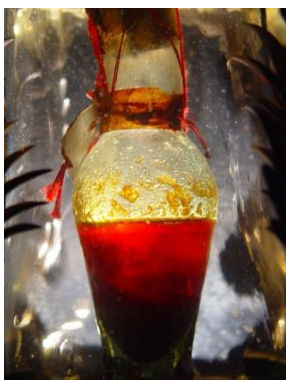
la teca col sangue di s.lorenzo

Le informazioni per prenotare e i costi di partecipazione sono in fondo a questo volantino.