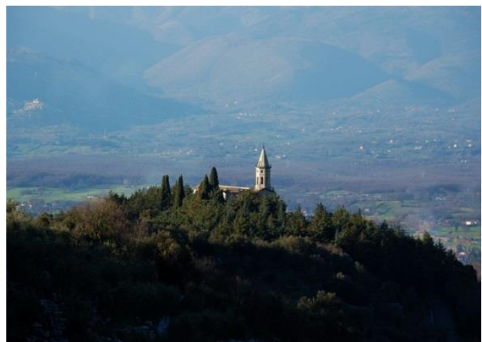
il santuario dell'Auricola

Venerdì 27/4/18 partenza ore 9.30, rientro ore 17.30 - Spostamenti in bus privato Quota a persona 20 euro (minimo 25 persone) - Possibilità di pranzo in locale convenzionato a 15 euro Prenotazione e versamento della quota presso il Museo, tel. 0698499479-3284117535 Appuntamento ad Anzio, viale Paolini (affianco Villa Adele) alle 9.15 per la registrazione.